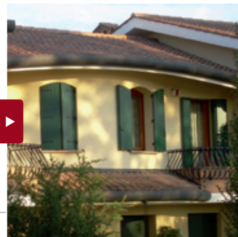
Das Brettladen-System Grado – der ganze Charme des Rustikalen. Auch als Faltiladen-System lieferbar.